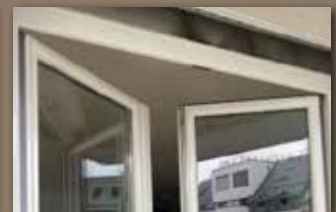
Reparatur mit Wow-Effekt