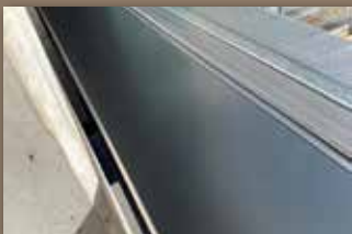
Keine Spur mehr zu sehen