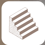
Stein & Beton