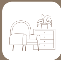
Möbel & Oberflächen