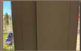
Alles wie neu