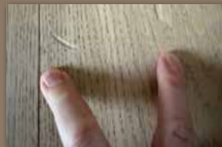
Holzboden mit Macke