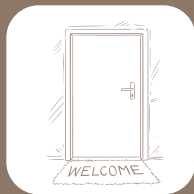
Türen & Böden