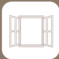
Glas & Aluminium