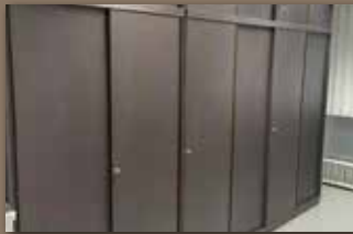
Refresh durch neue Folien