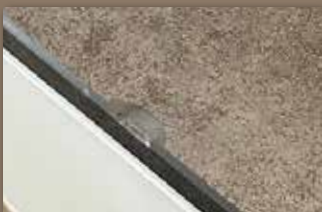
Keramikplatte mit Abplatzung