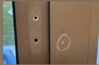
Fehlbohrung in Fenster