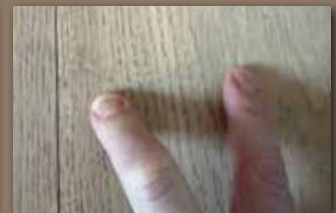
Keine Spur mehr zu sehen